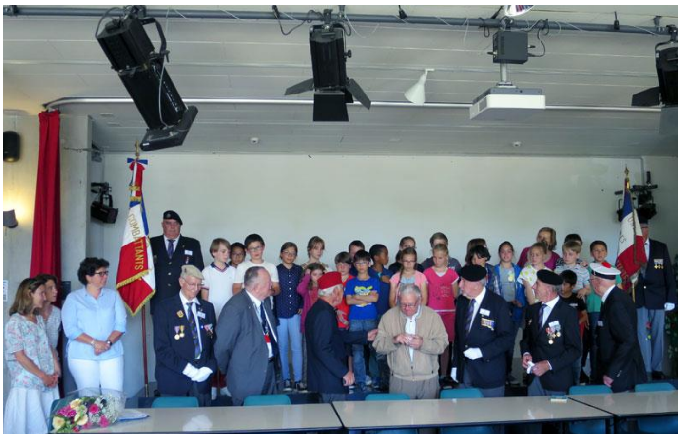
Les enfants de la classe de CM2 de Lausanne-Valmont avec leur institutrice, le comité UACF, les personnalités